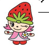
イメージキャラクター「わたリーナ」

JAの掛金負担で団体信用生命共済にご加入していただきます。もしも亡くなられた場合、ご家族にそのまま住宅は残り、住宅ローンは共済金で支払われます。 わたりがいのな！